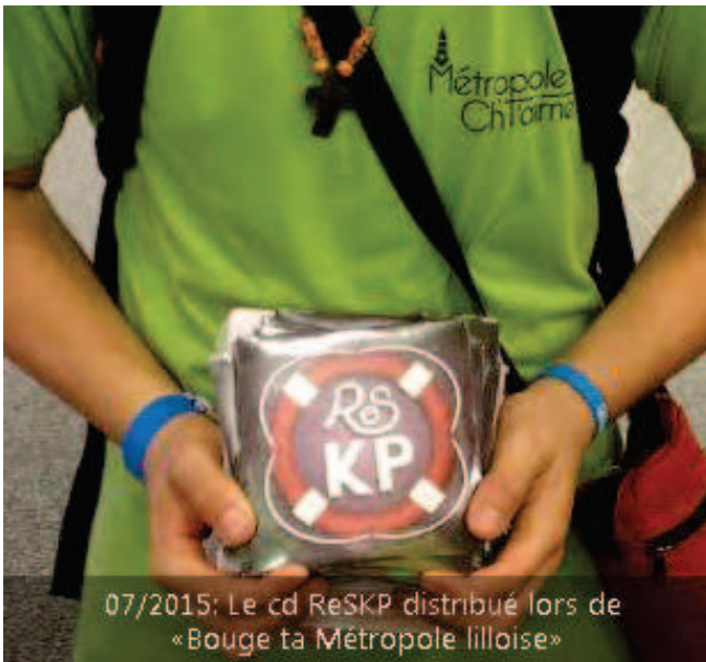
07/2015: Le cd ReSKP distribué lors de «Bouge ta Métropole lilloise»

Durant l'été 2015, 5 000 exemplaires de notre dernier CD «ReSKP» (20 000 cd édités à destination des jeunes) ont été confiés à JPC pour qu'ils soient distribués lors de leurs différents camps d'évangélisation (Plagestation, Bouge ta ville, etc) et 4 000 ont pu être donnés en main propre aux participants de Ze Rencontre en avril à Mulhouse.