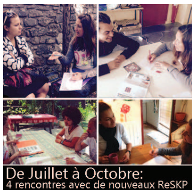
De Juillet à Octobre: 4 rencontres avec de nouveaux ReSKP